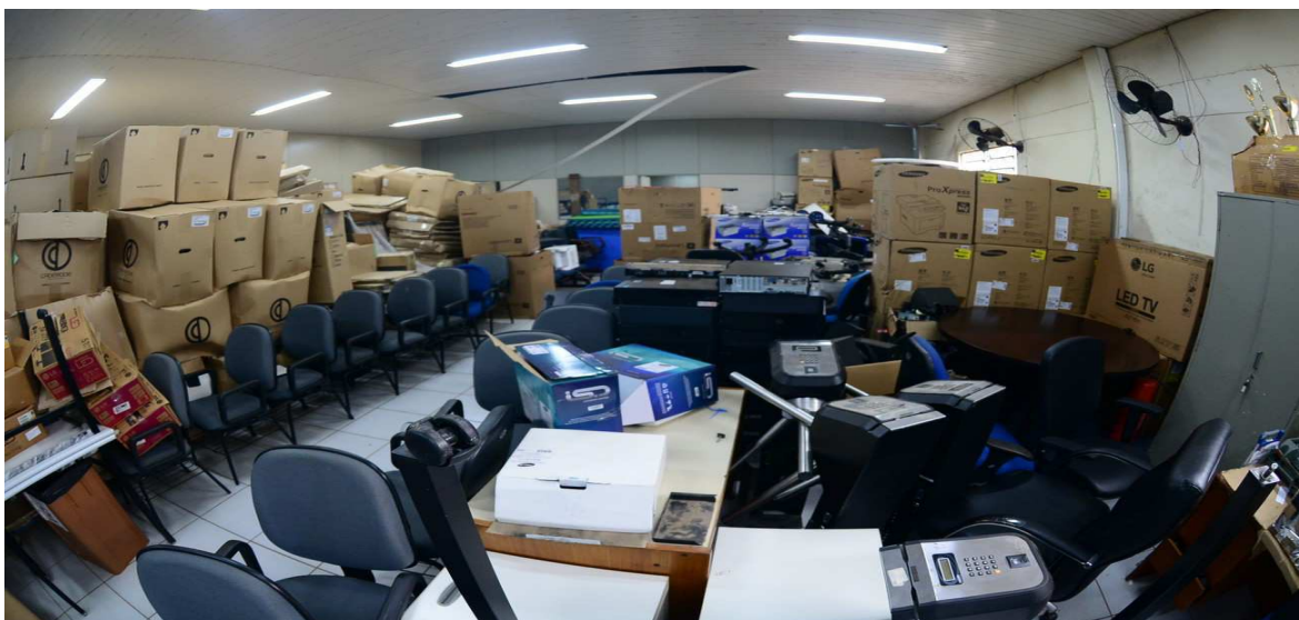
Bens permanentes armazenados na garagem localizada no Anexo I do TRT14 Fotos tiradas no início da Auditoria