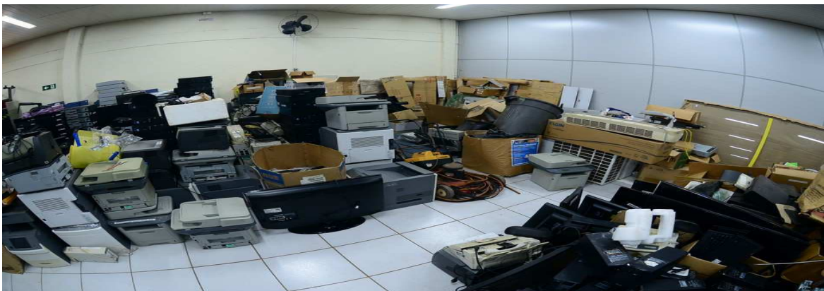
Bens novos permanentes armazenados no depósito do NMP Fotos tiradas no início da Auditoria