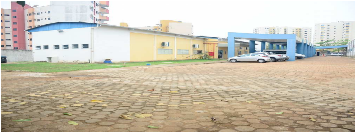
Bens permanentes em desuso armazenados no depósito do NMP Fotos tiradas no início da Auditoria