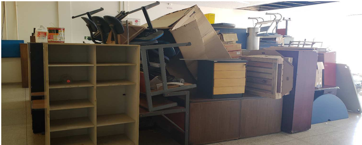
Depois da Auditoria