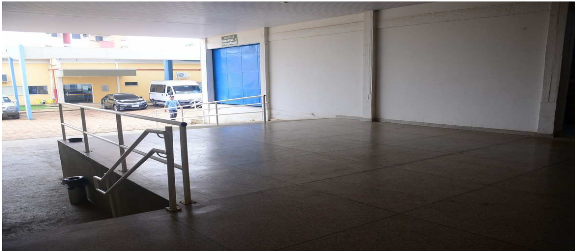
Pátio do Anexo I do TRT14 – Veículos em desuso Fotos tiradas no início da Auditoria.