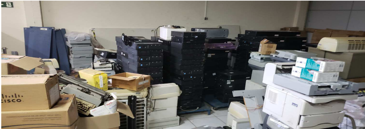
Depois da Auditoria